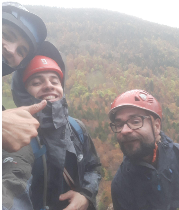
Début de la voie, on est encore à peu près sec