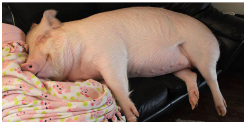
Joseph pendant ses activités du jeudi

La journée était encore plus pluvieuse que la précédente. Après toutes ces aventures, nous n'étions pas trop malheureux de voir que le temps était mauvais, ça nous a donné une excellente excuse pour passer la journée à nous reposer en : buvant des bières - en jouant aux jeux de société - en lisant - en faisant la sieste (choisir une ou plusieurs options). Fabien, qui se sentait mieux, à quand même réussi à sortir son vélo et à faire une belle petite sortie.