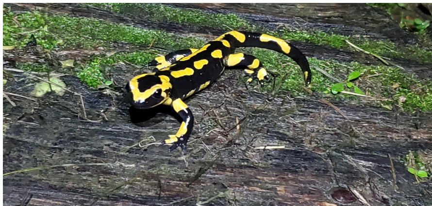
Une belle découverte d'une salamandre au retour au parking.

PS : on apprendra par la suite que nous avons fait du Sawanobori, une grimpe traditionnelle originaire du Japon.